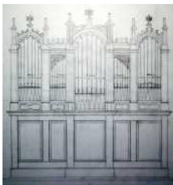
verm. Geänderte Fassade Aufenau